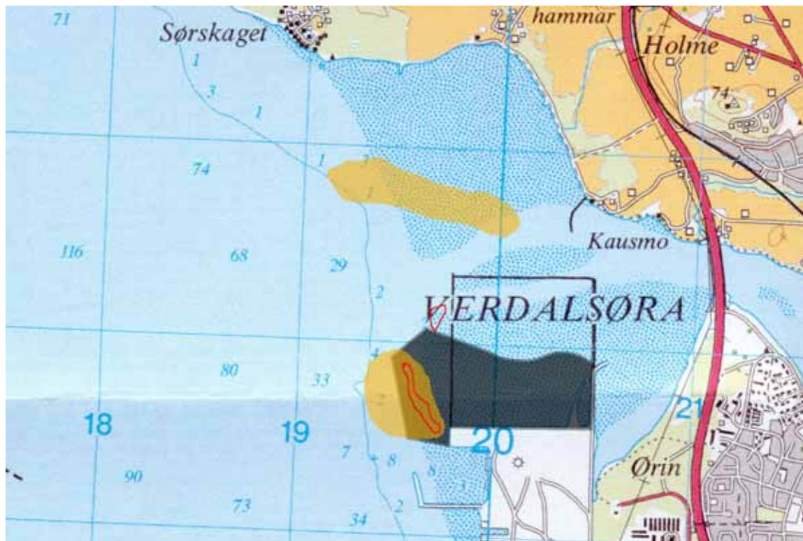
Fig 2: De røde feltene viser hvor det vokser blåskjell vest for moloen. Dette er viktig beiteområde for svartand, sjøorre, ærfugl og havelle. Vi har ikke sett fugl i den lille røde sirkelen, trolig fordi den ligger for nærme moloen. Områdene er oppmerket med GPS ved fjære sjø. Det finnes også blåskjell i elveløpet nord for moloen, men den forekomsten er ikke nøyaktig kartfestet. De oransje feltene viser områdene med klart hyppigst forekomst av svartand og andre dykkender. Det oransje feltet nord for moloen samsvarer med nåværende elveløp. Det mørke feltet viser hvordan det nye industriområdet er plassert i elvedeltaet og i forhold til den eksisterende moloen. Grunnlaget for Fig.2 er observasjoner fra en rekke besøk på Ørin til ulike årstider. Blant annet fra tellingene i forbindelse med Konsekvensutredningen (KU).